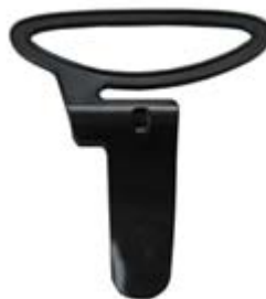
Насадка для брюк